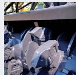
DCR - система ограничения среза